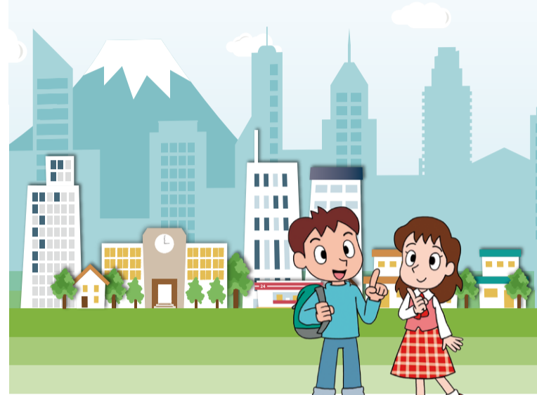
ヒトミとケンタが「人権プラザ」を訪ねてみました。どんな施設なのかな？

人権について楽しく体験して学べる展示室、セミナールームや図書資料室などがあります。人権に関する相談も受け付けています。