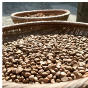
榎の実。かつては水俣にも榨油工 場があったという。

事実そうだったんです。隣に住む従 妹は2歳の頃に水俣病を発症しました。 彼女とは小さなころから遊んでいまし た。でも、おとなになって、銀行で彼女 とばったり会ったとき、水俣病のことが