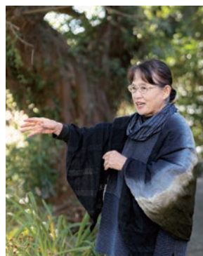
自宅にあるアコウの木の前で。石 段を下りると、今は水俣湾埋め立 て地「エコパーク水俣」が広がっ ている。

ずっと嫌だと思っていた私は、声をかけ られなかつたんです。彼女は話し方にも 歩き方にも症状がみとれました。声を かければ、周りにいる人に、私が水俣病 の人と親戚だつて知られてしまう。それ を恐れて、声をかけずに帰ってきてし まつたのです。